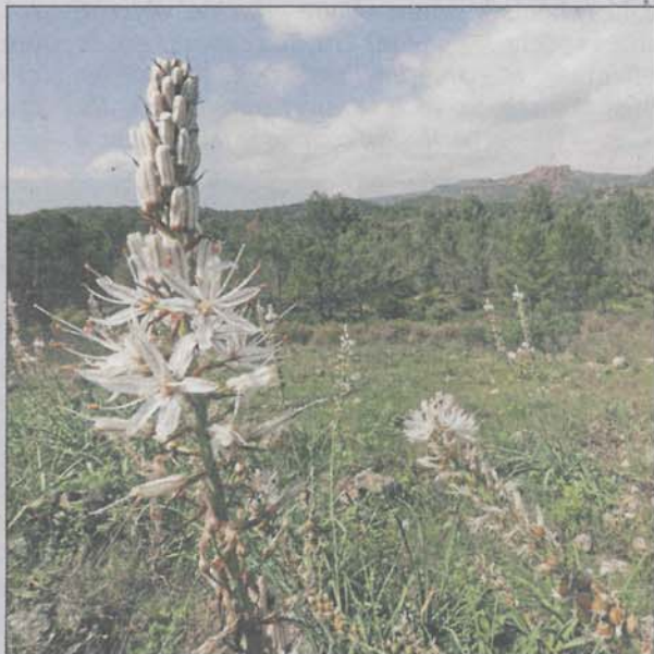
Les asphodèles sont en pleine floraison dans l'Estérel, en ce moment.

S'il ne fallait retenir que quelques trésors à protéger et que l'on trouve dans le massif, « d'importance nationale ou supra-nationale », Philippe Renaud-Bezot de l'ONF liste, côté faune, « les tortues d'Hermann et les cistudes d'Europe, l'aigle royal, le faucon pèlerin, le hibou grand duc, le merle bleu, les cerfs, les chevreuils, les chauve-souris, les libellules agrions de Mercure et bien d'autres insectes ou lézards. » Puis, côté végétaux, « citons l'ail de sicile, la barbe de Jupiter, l'osmonde royale, les lauriers roses sauvages, etc. »